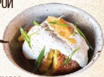
СЕЛЬДЬ С ЯЛТИНСКИМ ЛУКОМ С ПЕЧЁНЫМ КАРТОФЕЛЕМ, ЗЕЛЁНЫМ ЛУКОМ И СО СМЕТАНОЙ