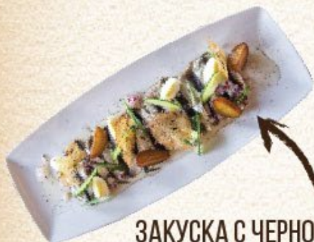
ЗАКУСКА С ЧЕРНОМОРСКОЙ КИЛЬКОЙ СОБСТВЕННОГО ПОСОЛА