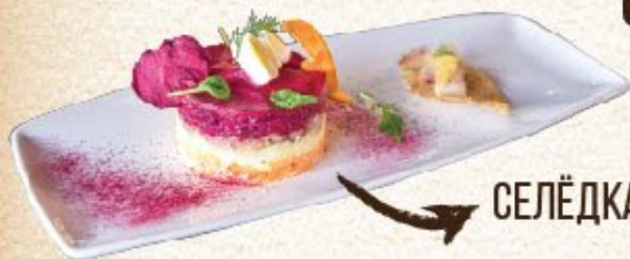
СЕЛЁДКА ПОД ШУБОЙ 320 ₺