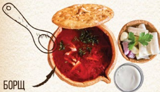
БОРЩ С СОЛЁНЫМ САЛОМ