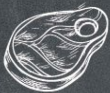
ОСТРЫЕ МЯСНЫЕ ШАРИКИ с горчичным соусом 390 ₺